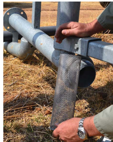
Die balkspuit se filter is 'n stewige sif wat onlangs verhoed het dat 'n meerkat in die spuit beland.

Kontak vir Tobie van den Heever van Irrigation Unlimited by 082-658-6054 vir enige navrae.