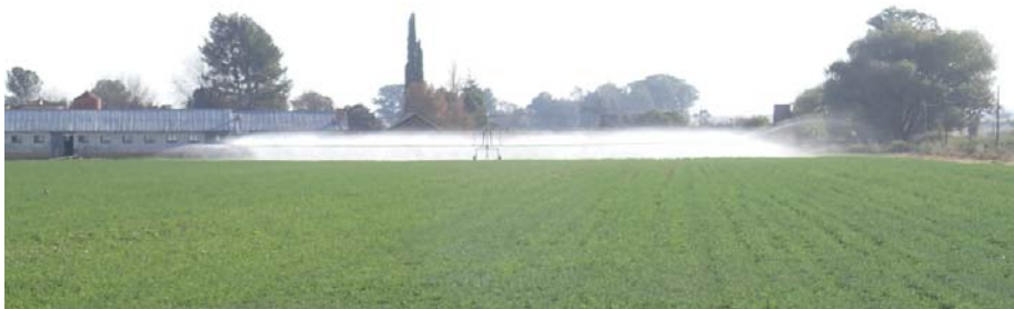
Die Ocmis-balkspuit rol statig en stadig oor die luserland terwyl dit die grond deeglik benat.